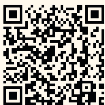
参加申し込み 専用QRコード