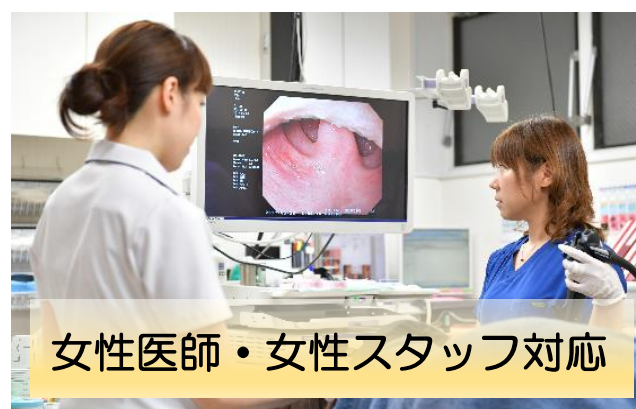
女性医師・女性スタッフ対応