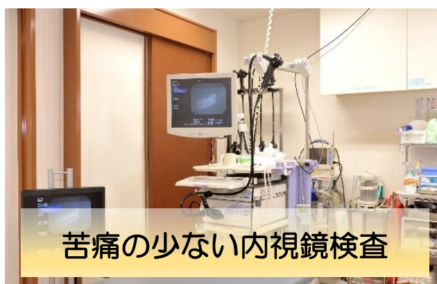
苦痛の少ない内視鏡検査